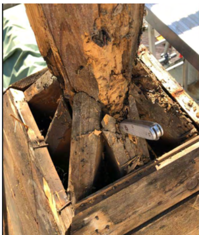
Defekter Glockenturm

Bei der Dachsanierung hat sich herausgestellt, dass das Glockenturmdach komplett erneuert werden musste. Dieses wurde beim Umbau des Gebäudes im Jahre 2000 nicht erneuert.