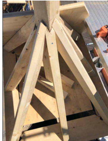
Neuer Glockenturm, Foto M. Sager

In der Zwischenzeit hat jedoch auch unsere Glocke wieder ein Dach.