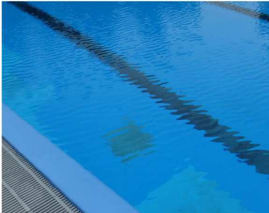
Fest installiertes Schwimmbecken

Das vorliegende Merkblatt richtet sich an Inhaber von privaten Schwimmbecken und von mobil aufstellbaren Pools. Gezeigt sind die Grundsätze zum umweltgerechten Umgang mit Becken-, Pool- und Reinigungswasser.