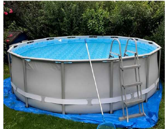
Mobil aufstellbarer Pool im Garten