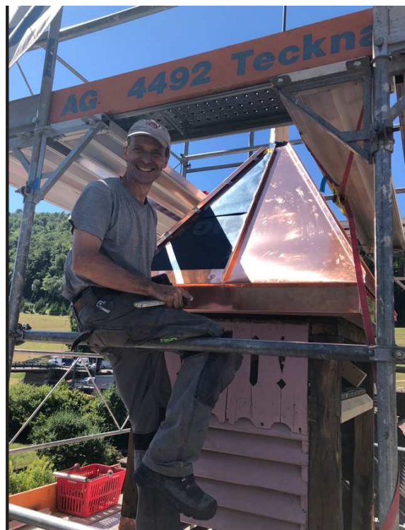
Spenglermeister bei der Arbeit

Die Fensterläden werden farblich wie bestehenden erneuert. Mit der Wahl der Fassaden-Farbe, sowie die Farbe für Türeinfassung und Kreuzstock wird der «Farbkultur im Baselbiet» für schützenswerte Baute im Dorfkern nachgekommen. Diese Änderung wurde von der Kantonalen Denkmalpflege geprüft und für ortsbildverträglich befunden.