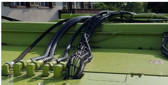
Bild: Öl- und Stromversorgung Fahrzeug der Kehrriechabfuhr

Die ganze Öl- und Stromversorgung für die Presse verläuft über das Fahrzeugdach, da das Heckteil zur Entleerung des Fahrzeuges angehoben werden muss.